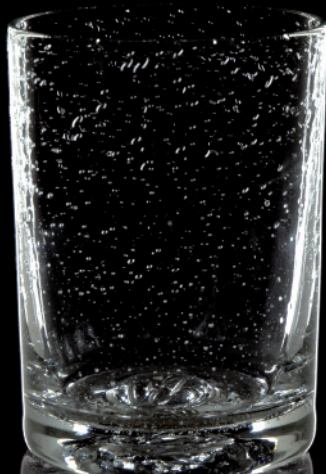
MARTHA ALBA großer Tumbler