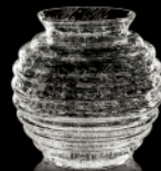
MARTHA FELICITAS Vase Art Deco Bauhaus Design