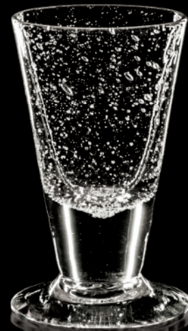
MARTHA AMALIA Südweinglas

Die Abbildungen zeigen nur einen Auszug aus unserer neuen Antikglasserie MARTHA.